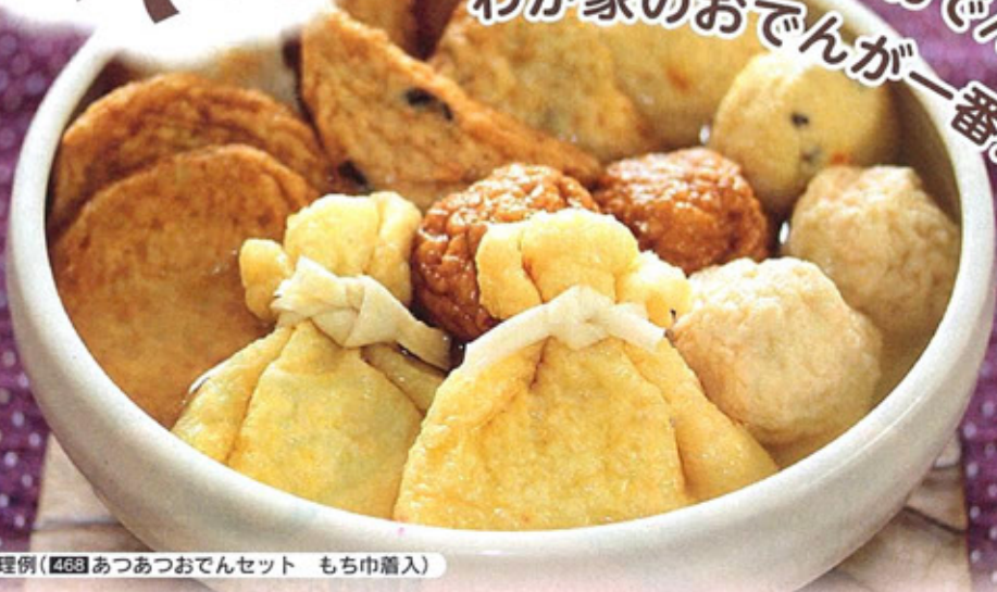
調理例(468 あつあつおでんセット もち巾着入)

468 次期予定 蔵 未定 あつあつおでんセット もち巾着入 8種15個、スープ1袋(25g) 348円(税込375円) 卵麦 賞お届け日含め5日 阿部善商店(宮城県) GMO