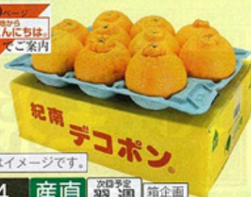
箱はイメージです。