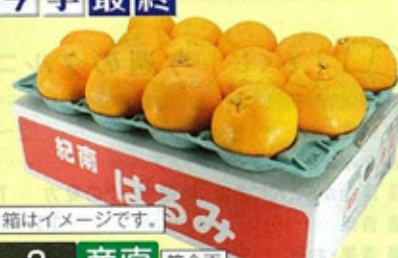
箱はイメージです。