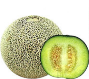
メロンのLサイズは 小ぶりです。

52 産直 次回予定 翌週 ブロッコリー 1株・Lサイズ以上 168円(税込181円) いいがた村 枝豆生産グループ(新潟市)