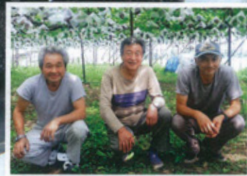
中之口ぶどう愛好会のみなさん