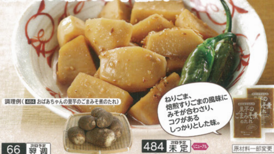
調理例 (288) おばあちゃんの里芋のごまみそ煮のたれ

ねりごま、 焙煎すりごまの風味に みそが合わさり、 コクがある しっかりとした味。