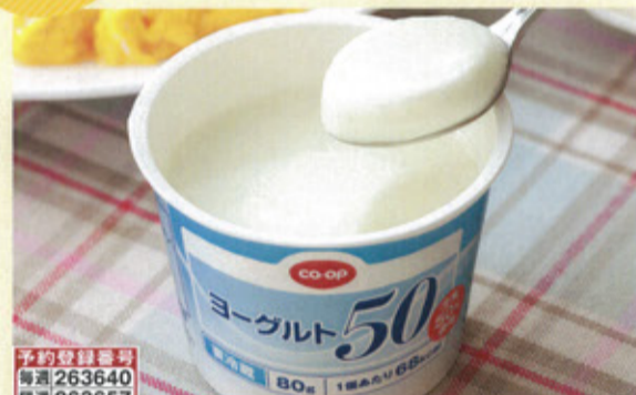
予約登録番号 毎週263640 隔週263657

612 CO-OP 次回予定 翌週 蔵 ヨーグルト50 80g×6 188円(税込203円) 乳 15日 株式会社 協栄(群馬県) GMO