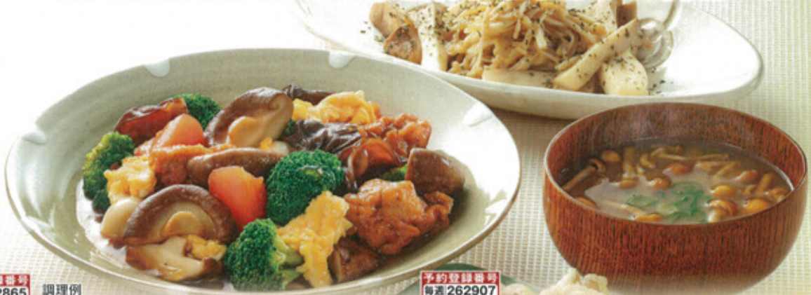
予約登録番号 毎週 262865 隔週 262873 調理例

90 産直 次回予定 翌週 五十嵐さんのぶなしめじ 170g 120円(税込129円) きのこ生産者の会 五十嵐さん(新潟市)