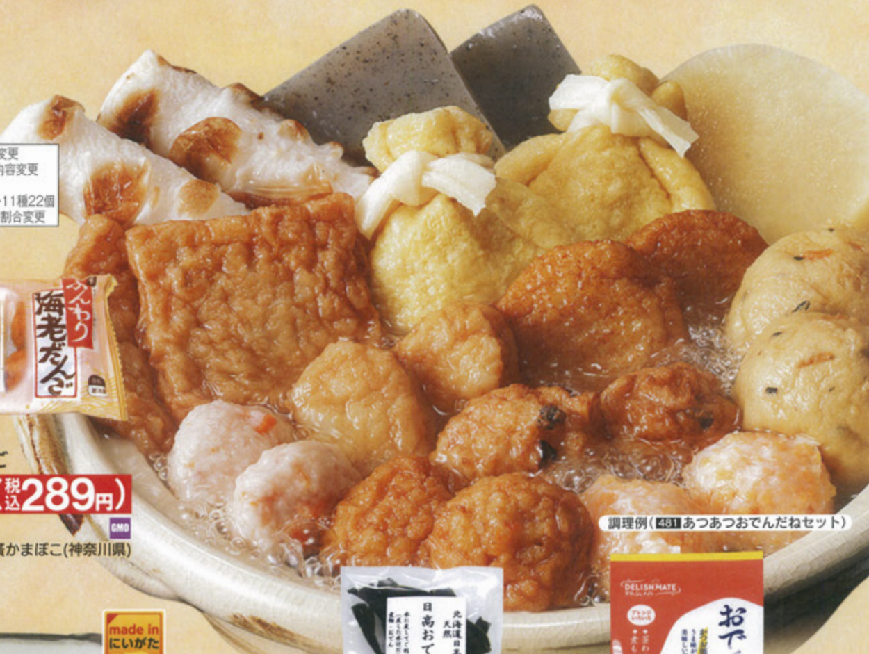
調理例(481あつあつおでんだねセット)

426 次回予定翌週 蔵 国産しらたき 180g 90円(税込97円) 賞61日 猪貝(新潟県)