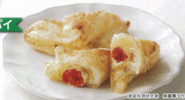
家庭料理研究家 奥菌 壽子作