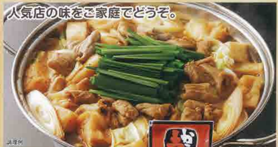
人気店の味をご家庭でどうぞ。

240 次期予定 凍 新潟長岡風 生姜醤油鍋 280g ..... 448円(税込483円) 調理例 国産 180日 北日本ホーム食品(新潟県) GMS