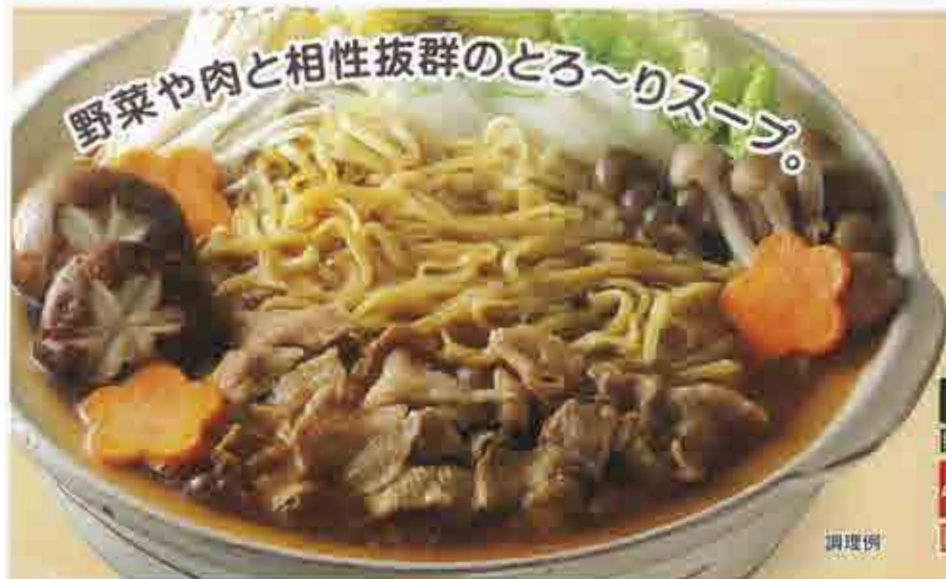
野菜や肉と相性抜群のとろ〜りスープ。