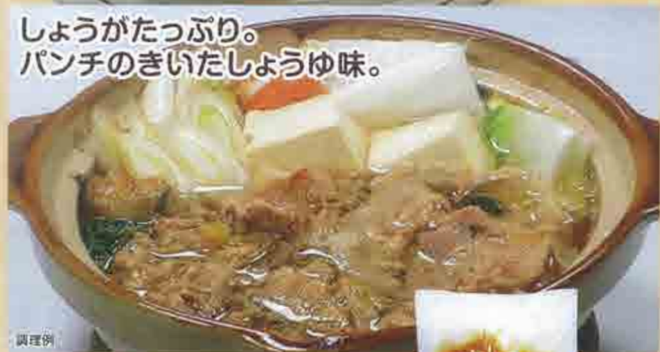
しょうがたっぷり。 パンチのきいたしょうゆ味。

240 次期予定 凍 新潟長岡風 生姜醤油鍋 280g ..... 448円(税込483円) 調理例 国産 180日 北日本ホーム食品(新潟県) GMS