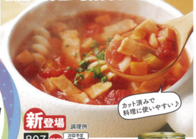
カット済みで料理に使いやすい!