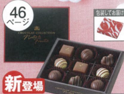
トリュフチョコレート

46 ページ 包装してお届け 新登場 702 未定 次期予定 モロゾフ ショコラコレクション(ナッツ&フルーツ) 9個 ..... 850円(税込918円) 原材料は46ページをご覧ください。