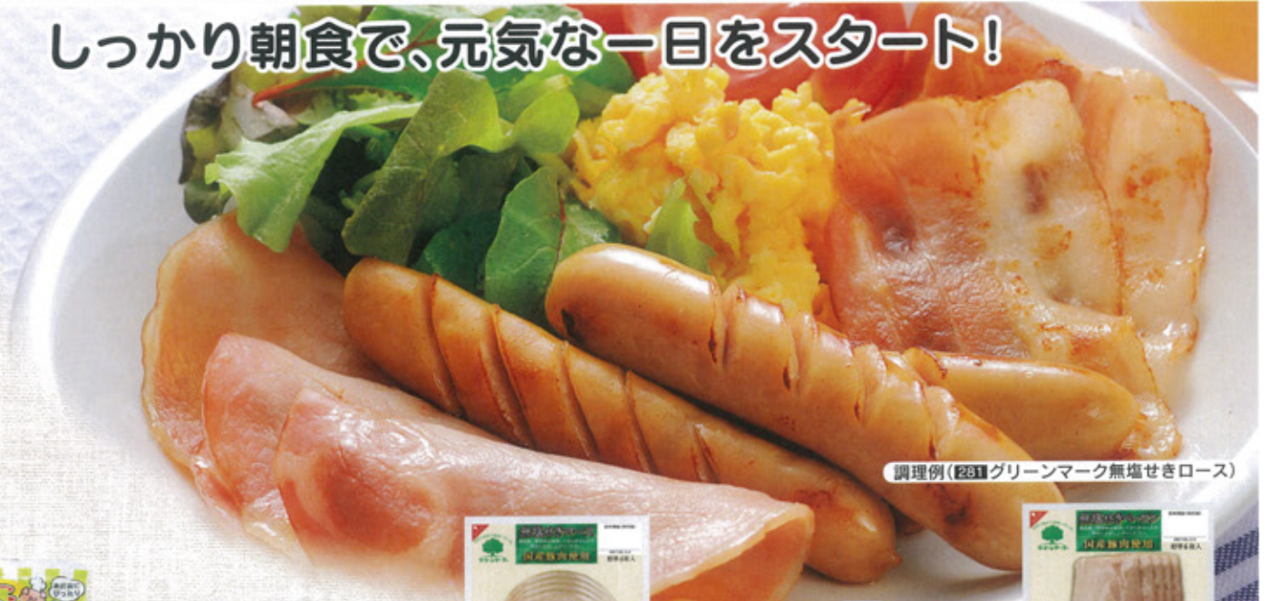
調理例(281)グリーンマーク無塩せきロース